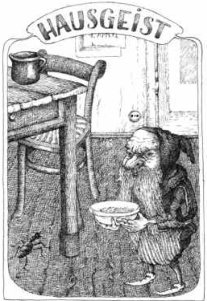
Bilder: Helga Gebert

schige Bärte, dichte Augenbrauen, lange Nasen und grosse, spitze Fledermausohren. Die englischen Erdleute, die Pixies, haben flammendrotes Haar, grosse Münder und schielen; die Erdleute der deutschsprachigen Länder haben absonderliche Gänse- oder Entenfüsse.